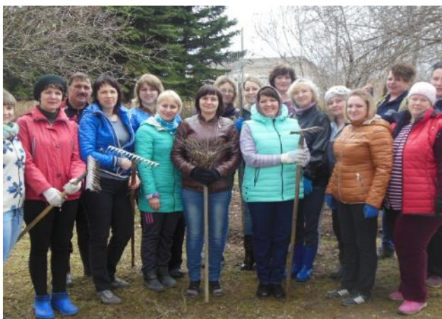
УСЗН Уренского района