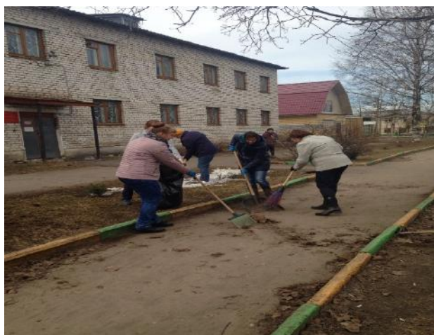
УСЗН Ветлужского района