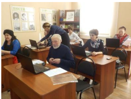
УСЗН Уренского района